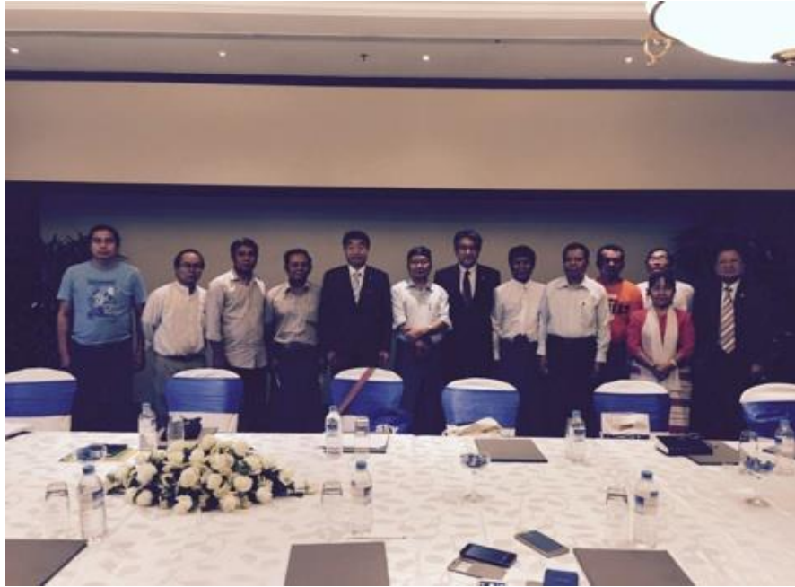
少数民族統一民族連邦評議会 (UNFC) らとの会議