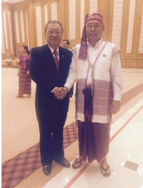
マン・ウイン・カイン・タン上院議長と面談