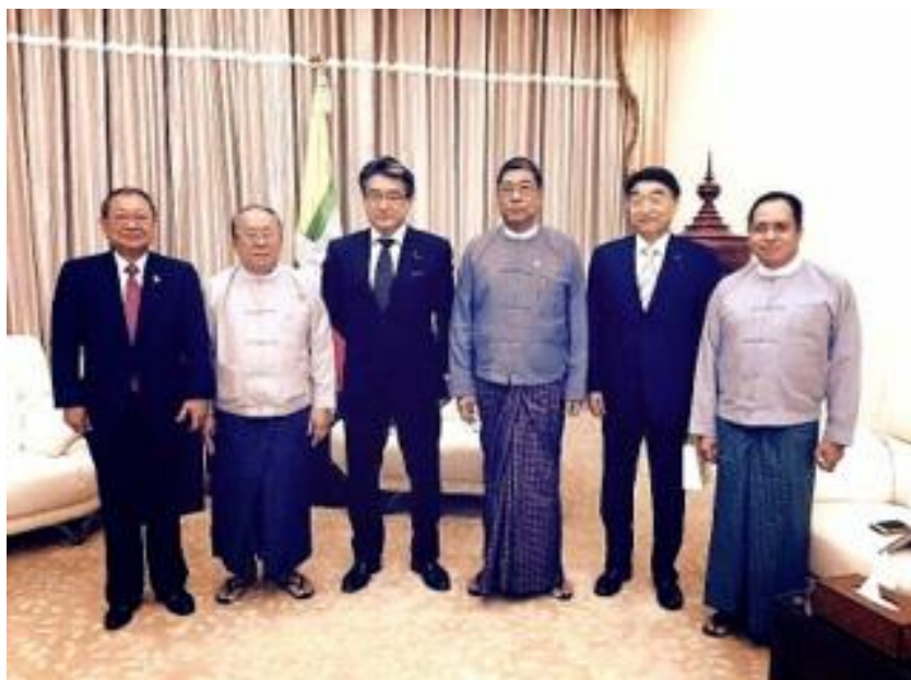
チョー・チョー・マウン中央銀行総裁 セ・アウン副総裁と会談