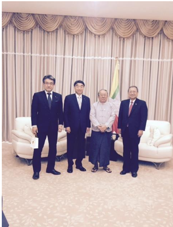
チョー・チョー・マウン中央銀行総裁と四者会談